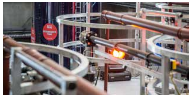
>> Physikalisch-biologische Aufbereitungsanlage, Premstätten

Umwelt zu leisten. Daher entwickelt das Recyclingunternehmen seine Verwertungswege hinsichtlich Effektivität und Effizienz laufend weiter. Mit der im Vorjahr eröffneten physikalisch-biologischen Aufbereitungsanlage werden erstmals Abwässer aus Ölabscheidern so aufbereitet, dass am Ende nur reines Brauchwasser übrig bleibt. Die innovative Verwertungsschiene stellt somit die erste abwasserfreie Aufbereitungsanlage für industrielle Abwässer in Europa dar. Vertrauen Sie daher bei der Wartung und Reinigung Ihrer Anlage auf den erfahrenen Spezialisten Saubermacher.